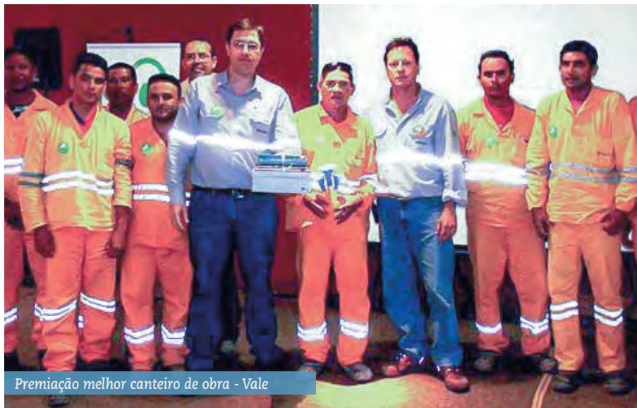
Premiação melhor canteiro de obra - Vale