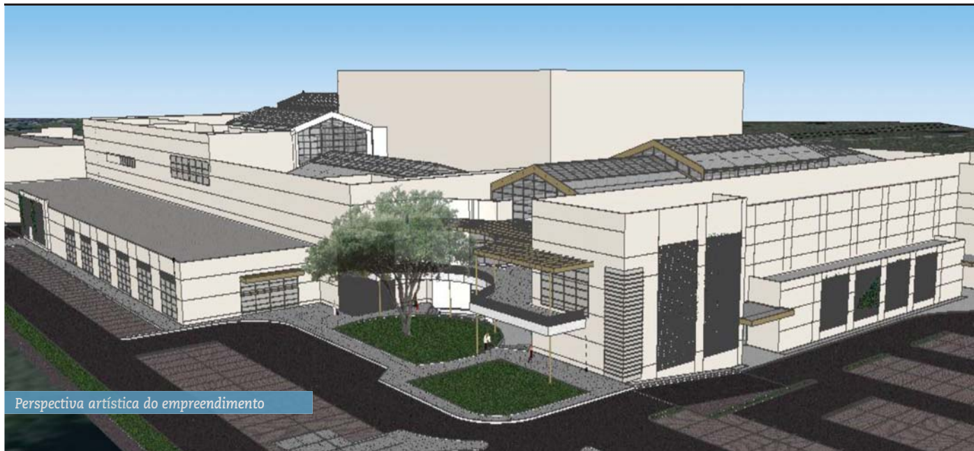
Perspectiva artística do empreendimento