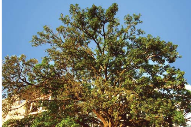
A figueira centenária do Iguatemi

O projeto procurou integrá-la ao shopping: a fachada foi curvada na região da gigantesca figueira, abraçando-a parcialmente. Foram desenvolvidos caixilhos com vista para a árvore e um terraço ao redor dela. ♦