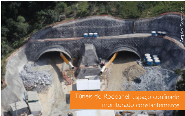
Túneis do Rodoanel: espaço confinado monitorado constantemente

Para obedecer a NR-33, empresa promove treinamentos constantes