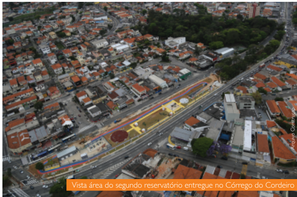
Vista área do segundo reservatório entregue no Córrego do Cordeiro

Segunda unidade concluída dos três reservatórios construídos pela Construcap, o RCO-03 foi entregue no fim de setembro.