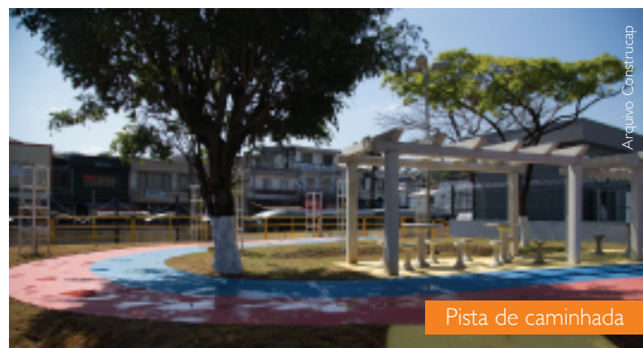
Pista de caminhada

Segundo reservatório fechado entregue fora do centro expandido da capital, o RCO-03 possui quatro bombas de sucção com 65 cavalos cada, dando uma vazão de 1.440 litros de água por segundo, o equivalente a mil duchas comuns ligadas ao mesmo tempo. Junto com o primeiro sistema de armazenagem, entregue em junho de 2016 e também construído pela Construcap, o complexo pode armazenar cerca de 72 mil m 3 de água pluviais, a mesma capacidade de 29 piscinas olímpicas juntas.