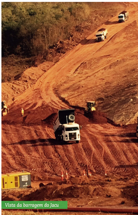
Vista da barragem do Jacu

O Projeto Serra do Salitre tem por objetivo fazer a extração e beneficiamento do minério de fosfato para a produção de fertilizantes. O encerramento está previsto para o fim de 2016. ♦